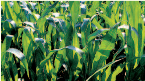
Optimales Wachstum durch ausgeglichene Stickstoffversorgung.

PIADIN® verzögert die Umwandlung des Stickstoffs von der stabilen Ammonium- zur mobilen Nitratform. Ammoniumstickstoff ist im Gegensatz zu Nitratstickstoff an die Bodenteilchen gebunden, kann nicht ausgewaschen werden und steht den Pflanzen lange im Wurzelbereich zur Verfügung. Die so erreichte ammoniumbetonte Pflanzenernährung hat viele Vorteile. Sie führt zu verbesserter Wurzelbildung, gleichmässigerer und dem Bedarf angepasster Nährstoffversorgung und vermeidet unerwünschten Luxuskonsum mit Folgen wie Lagergetreide und Schaderregerbefall. Zusammen mit der bedarfsgerechten Nitratfreisetzung aus diesem Depot wird eine harmonische Nährstoffversorgung mit höheren Erträgen und besserer Qualität erreicht.