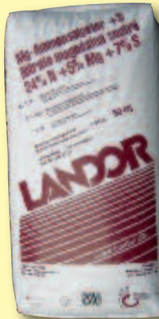
Mg-Ammonsalpeter 24 % N + 5 % Mg + 7 % S

Weitere LANDOR Dünger mit Schwefel finden Sie in der aktuellen Düngerliste. Ihr LANDOR Berater gibt Ihnen gerne Auskunft.