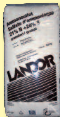
Ammonsulfat 21 % N + 24 S