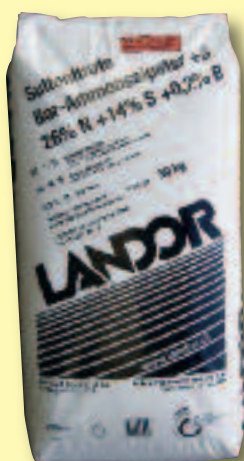
Bor-Ammonsalpeter 26 % N + 0.2 B + 14 S